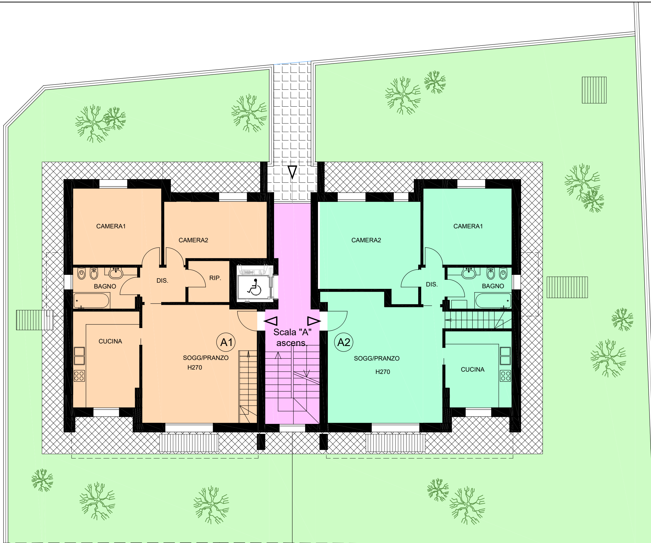
PIANTA PIANO TERRA - scala 1:100